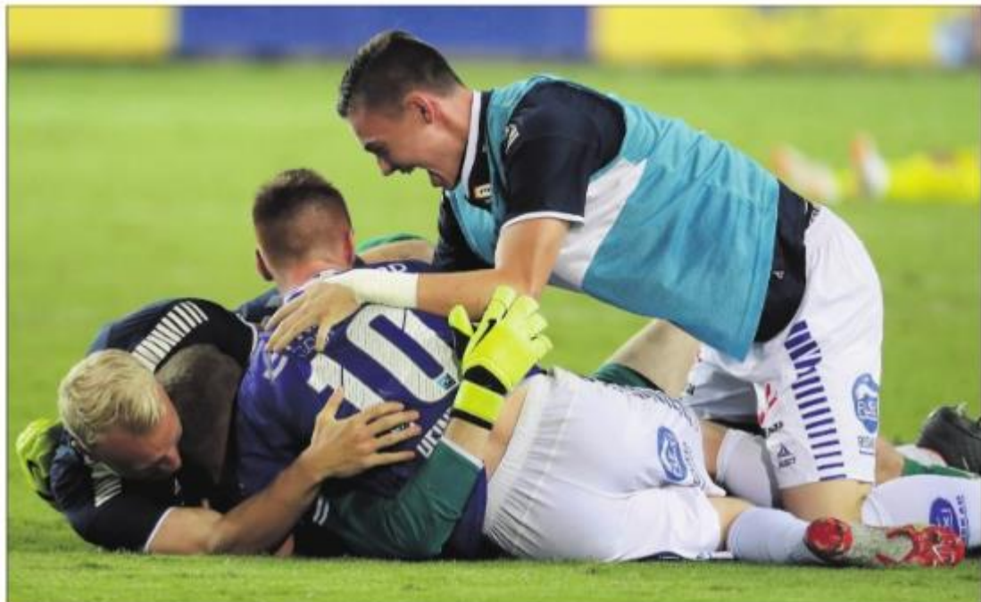
ELLEVILT: Sarpsborg 08-spillere kunne jubile hemningsløst etter å ha tatt seg videre til gruppespillet i Europa League.

Det må være lov å være stolt av Sarpsborg nå!