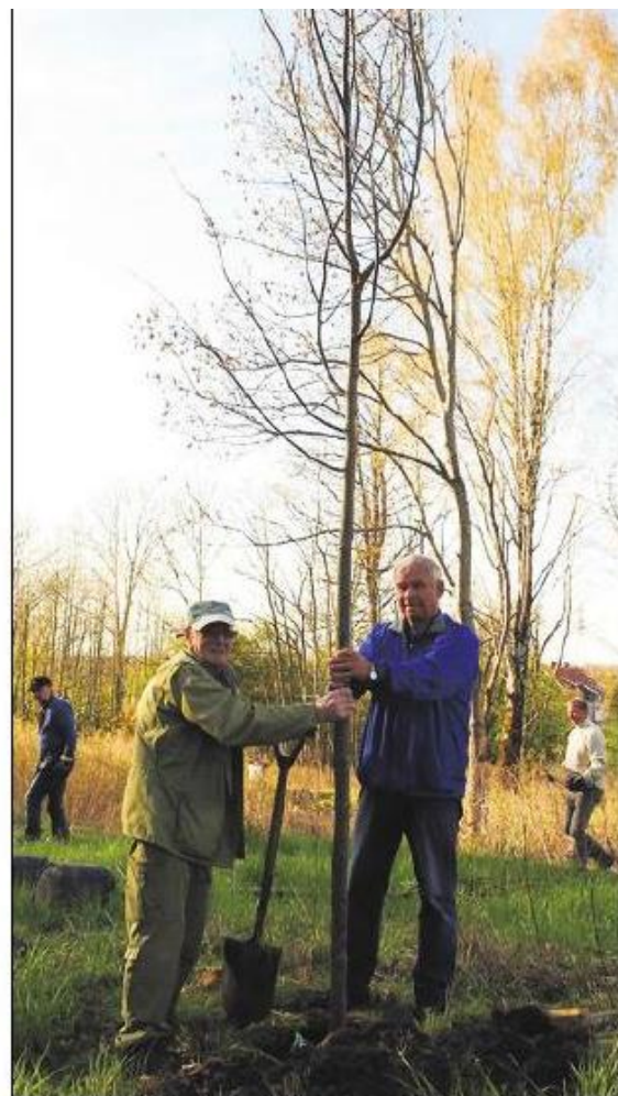
DUGNAD: Skjeberg Rotaryklubb har tatt på seg ansvaret med å gjenskape inngangen til frontalleen til Hafslund hovedgård.